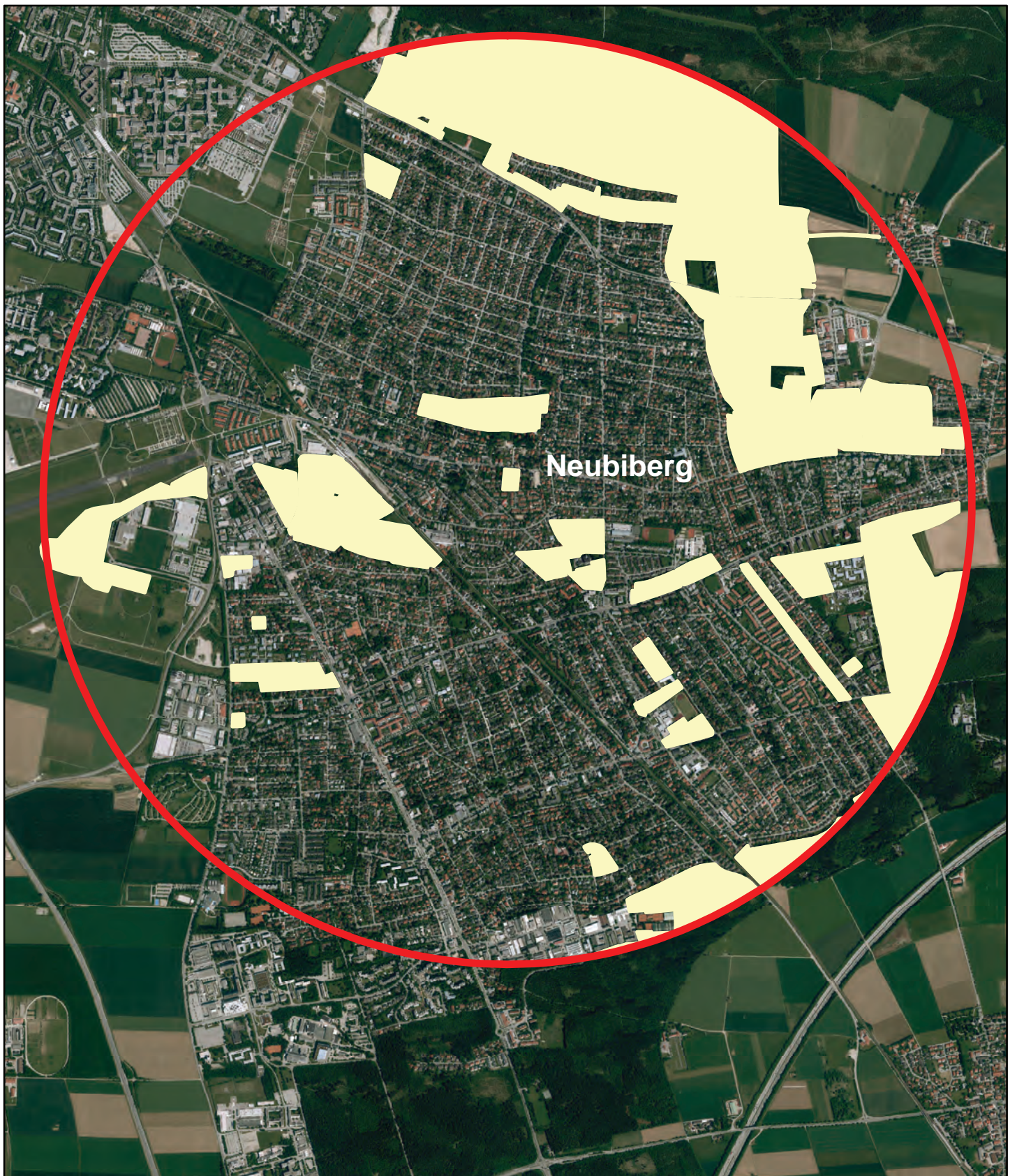
Plan der Quarantänezone, festgesetzt mit der Allgemeinverfügung des AELF Ebersberg über Maßnahmen zur Bekämpfung des Asiatischen Laubholzbockkäfers vom 16.09.2014