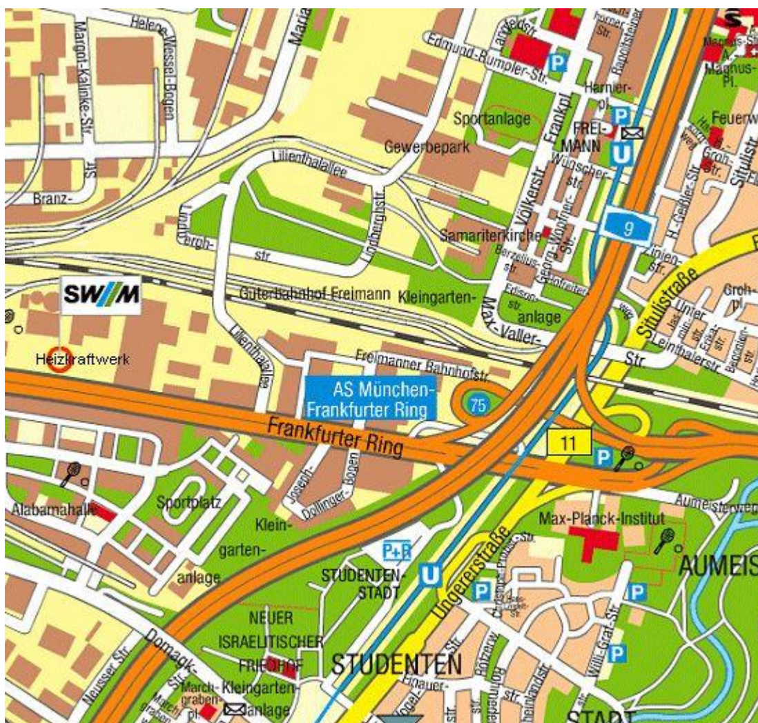
Abb. 1-1: Umgebungskarte ohne Maßstab

Der Standort der geplanten Anlage, das HKW Freimann, befindet sich im Münchner Stadtteil Schwabing-Freimann (Stadtbezirk 12). Die Zufahrt zum Heizkraftwerk erfolgt direkt vom Frankfurter Ring (siehe Abb. 1-1).