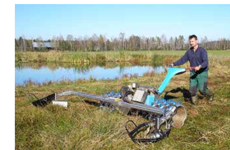
Eine Streuwiese wird gemäht und ...

wiesen überführt. Die Pflege wurde bis 2013 durch das vom Bayerischen Umweltministerium geförderte Modellprojekt „Landschaftspflegehof“ sichergestellt. Ziel des Projekts war, die großflächige Streuwiesenmahd so in landwirtschaftliche Stoff- und Wirtschaftskreisläufe einzubinden, dass sie langfristig rentabel ist. Die drei teilnehmenden Höfe führen das Projekt nun in eigener Regie weiter: Jeder Landwirt mäht pro Jahr etwa 30 Hektar Streuwiesen, um das Mähgut dann ganz traditionell als Einstreu in den Viehställen zu verwenden. Streu wird wieder gebraucht!