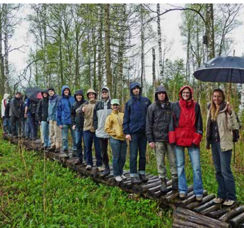
Auf Tour durchs Klosterland

Die Auswirkungen der Renaturierung des Klosterlands werden genau beobachtet, erforscht und dokumentiert – auch was deren Beitrag zum Klimaschutz angeht. Für das Management dieser Flächen verlieh der Landkreis Bad Tölz-Wolfratshausen dem ZUK den Umweltpreis 2005.