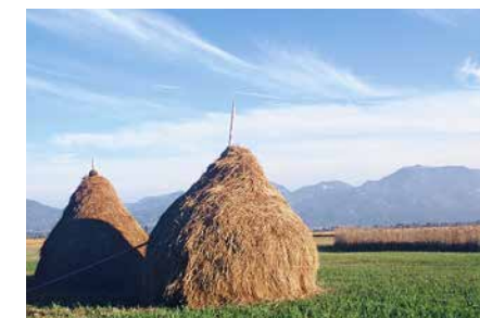
Streudrischen auf extensiv genutzten Wiesen