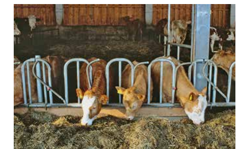
... das anfallende Material im Stall eingestreut.