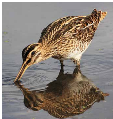
Bekassine bei der Nahrungssuche