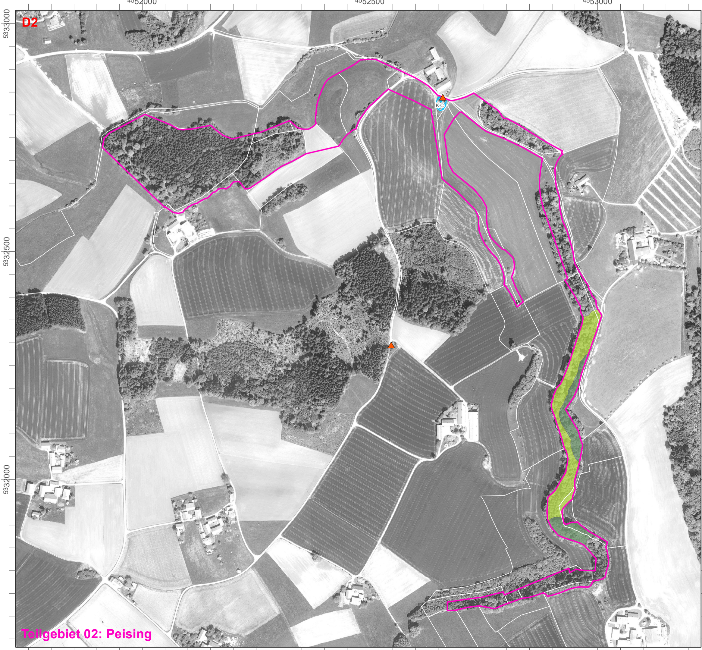
Teilgebiet 02: Peising