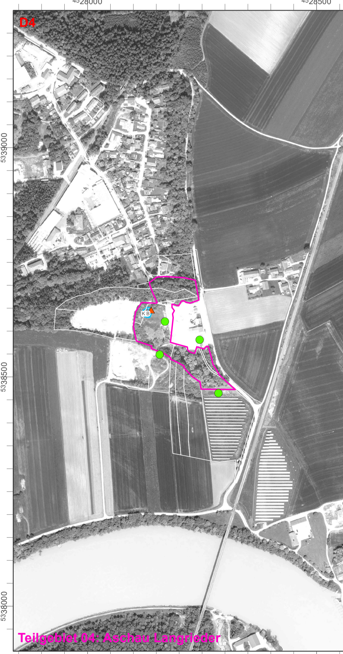
Teilgebiet 04: Aschau-Longfelder