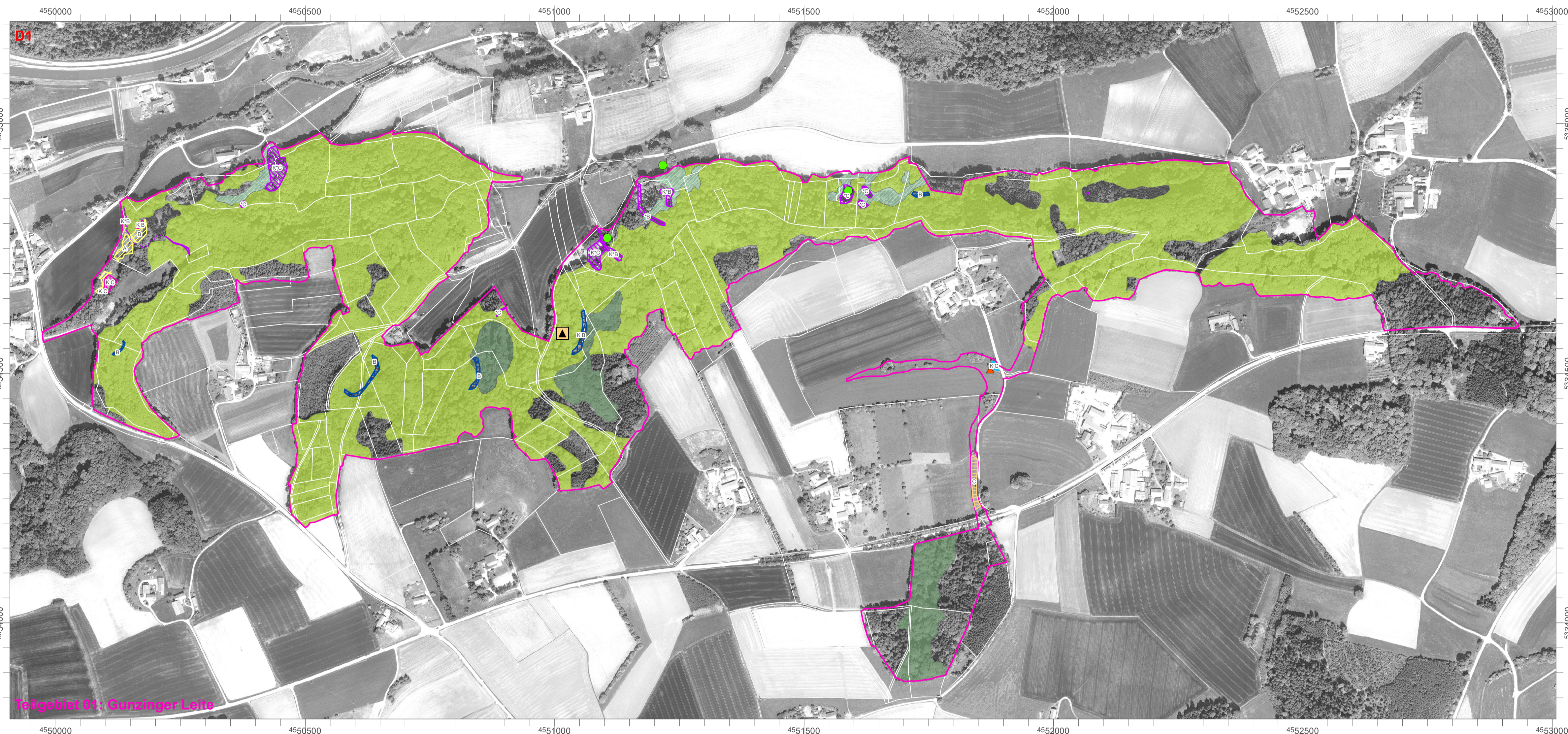
Teilgebiet 01: Gänzinger Laitz