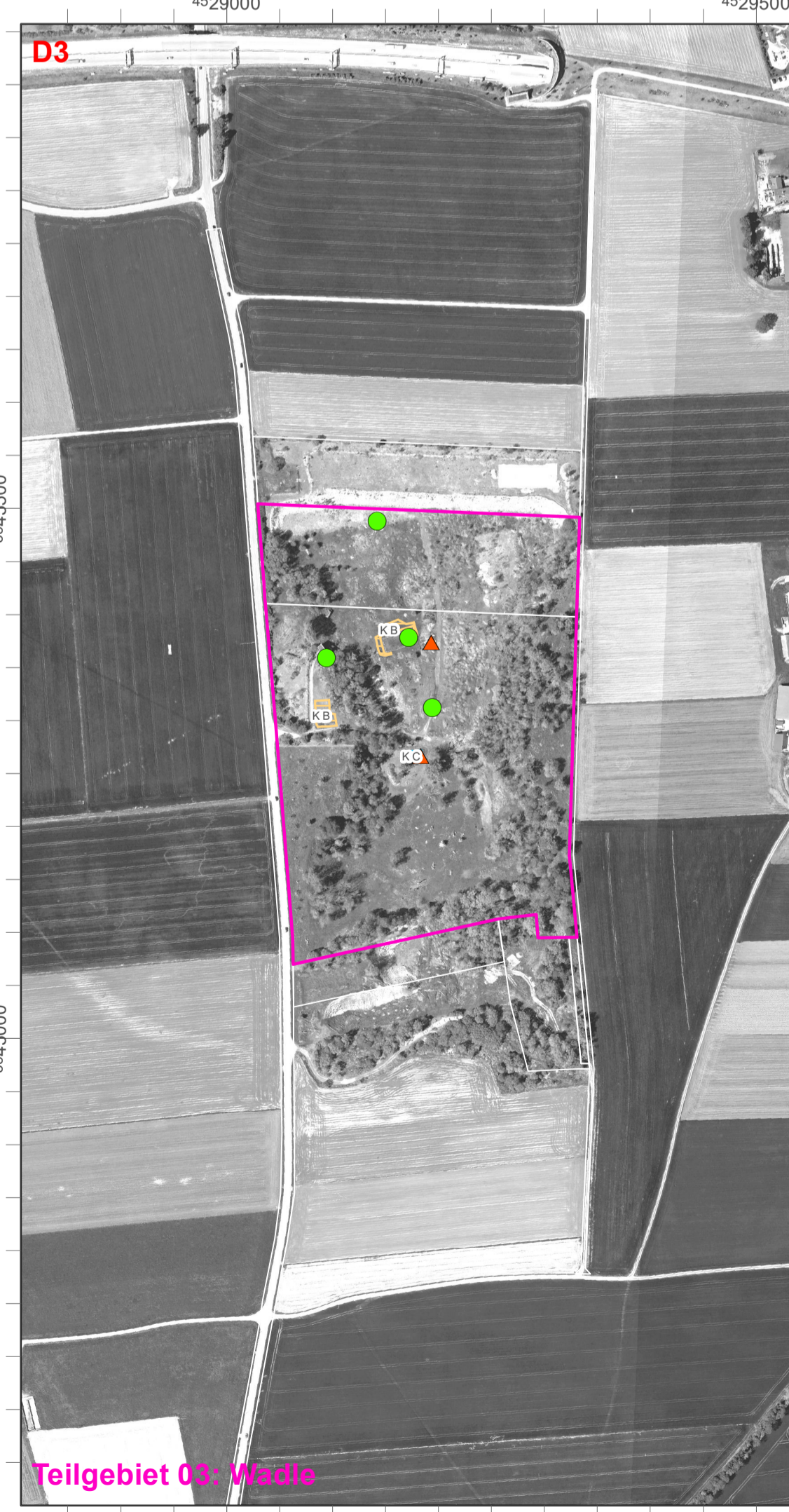
Teilgebiet 03: Madle