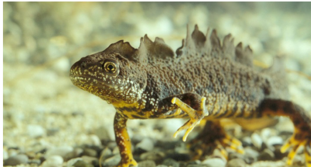
Abb. 21: Kammolch in einem Gewässer

Der Kammolch besiedelt das nördliche und mittlere Europa. In Bayern gilt er als stark gefährdet und bildet meist keine großen Bestände.