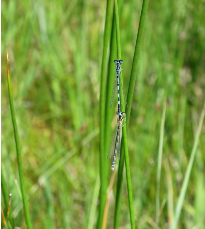
Abb. 22: Helm-Azurjungfer, Männchen (oben) und Weibchen (unten)

Die Helm-Azurjungfer gilt sowohl in Bayern als auch in Deutschland als vom Aussterben bedroht. In Mitteleuropa werden drei verschiedene Habitattypen besiedelt: kalkhaltige, langsam fließende, sommerwarme Gräben und Bäche, Kalkquellmoore, Flussauen. Charakteristisch für alle Gewässer ist ein seltenes oder fehlendes Austrocknen, eine geringe bis mittlere Fließgeschwindigkeit, Eisfreiheit im Winter, geringer bis mittlerer Nährstoff- und hoher Sauerstoffgehalt. Im Alpenvorland hat die Art ihren fast alleinigen Vorkommensschwerpunkt in kalkreichen Hangquellmooren.