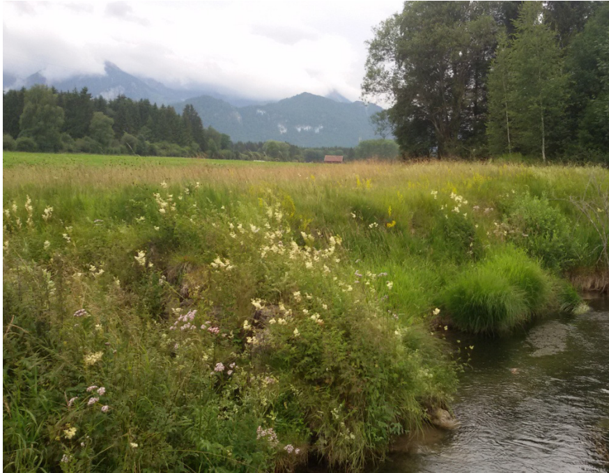
Abb. 5: Bach mit Hochstaudenflur aus Echem Mädesüß und Baldrian am steilen, unverbauten Ufer