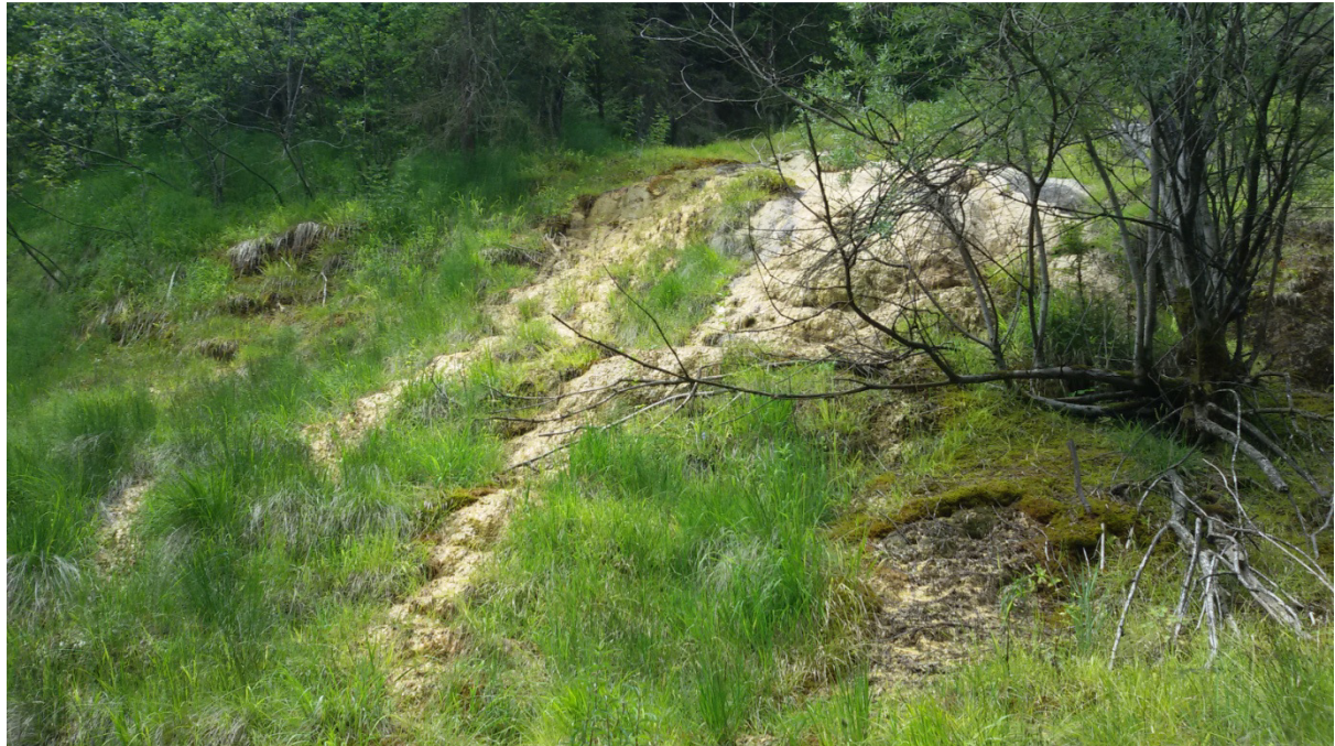
Abb. 7: Ausgedehnte Kalksinterterrassen mit Moosen an einem Hangfuß

sen. Es bilden sich mit der Zeit Kalksinterterrassen, die im Laufe der Jahre große Mächtigkeiten erreichen können.