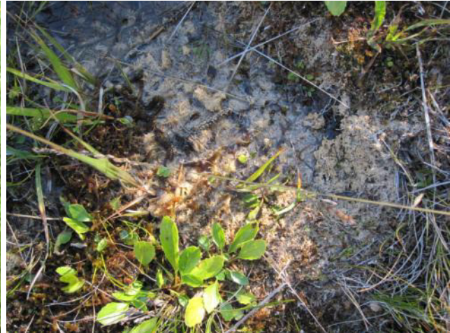
Abb. 10: Typisches Strukturelement in einem Kalk-Flachmoor: Kleiner Quelltopf mit von Kalkkruste überzogenen Moosen, typische Rosettenpflanze: Alpenmaßliebchen