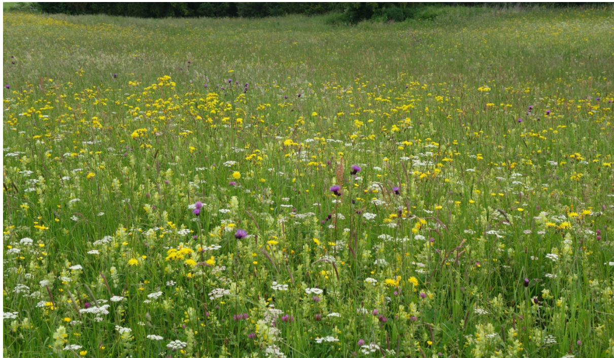
Abb. 17: Artenreiche Mähwiese mit Feuchtezeigern (Bach-Kratzdistel, blühend mittig) und mit viel Zottigem Klappertopf, Wiesen-Pippau sowie Wiesen-Kümmel

Magere Flachland-Mähwiesen zeichnen sich durch einen hohen Artenreichtum aus, sie sind meist krautreich und die Schicht der Obergräser mit Glatthafer ist nur schütter ausgebildet.