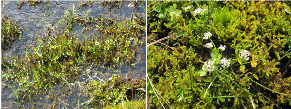
Abb. 19a,b: Kriechende Sellerie in einem kleinen Bach Kriechende Sellerie blühend im Landlebensraum

Im Landlebensraum dominiert die Ausbreitung über Samen, im Wasser durch bewurzelnde Sprosse.