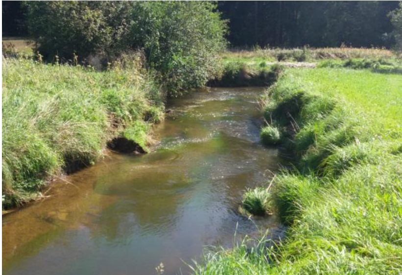
Abb. 3: Besonnter Abschnitt eines Bachs mit Flutendem Wasser-Hahnenfuß