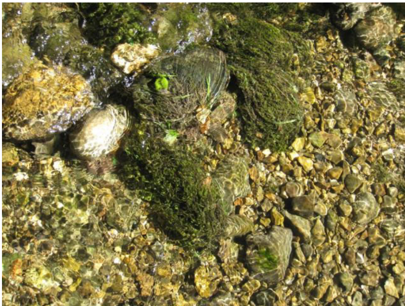
Abb. 4: Flutende Wassermoose ( Fontinalis antipyretica ) besiedeln schattigere Bachabschnitte