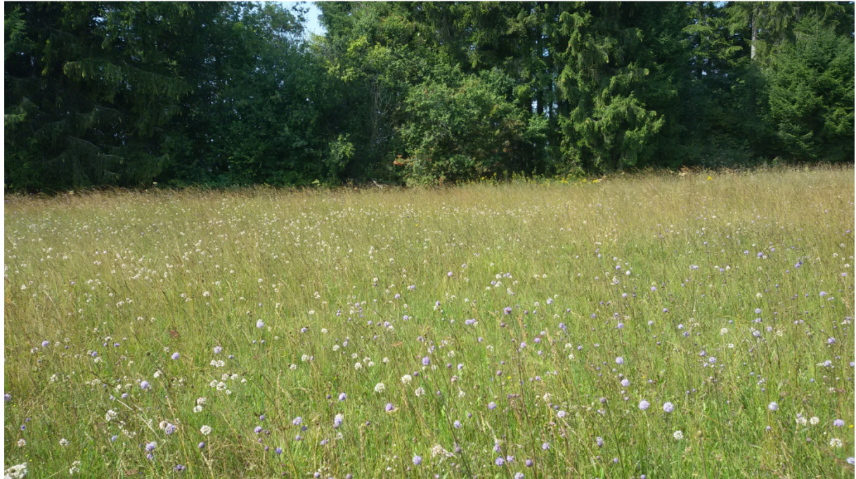
Abb. 16: Spät-Sommeraspekt einer Pfeifengraswiese mit Teufelsabbiss und Duft-Lauch