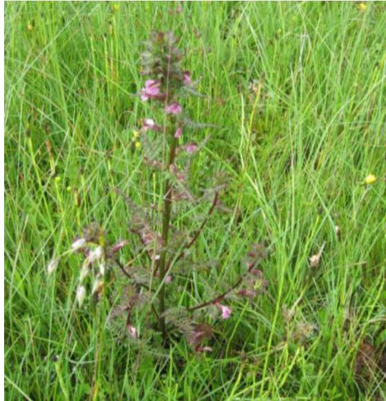
Abb. 9: Sumpf-Läusekraut im Kalk-Flachmoor mit Breitblättrigem Wollgras

Primel, Fettkräuter und Clusius-Enzian ihre Existenzmöglichkeit. Häufig sind die Niedermoo- re mit kleinen Quellen vergesellschaftet.