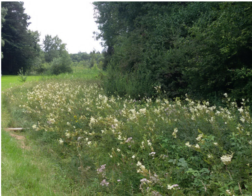
Abb. 6: Mädesüßsaum am Waldrand