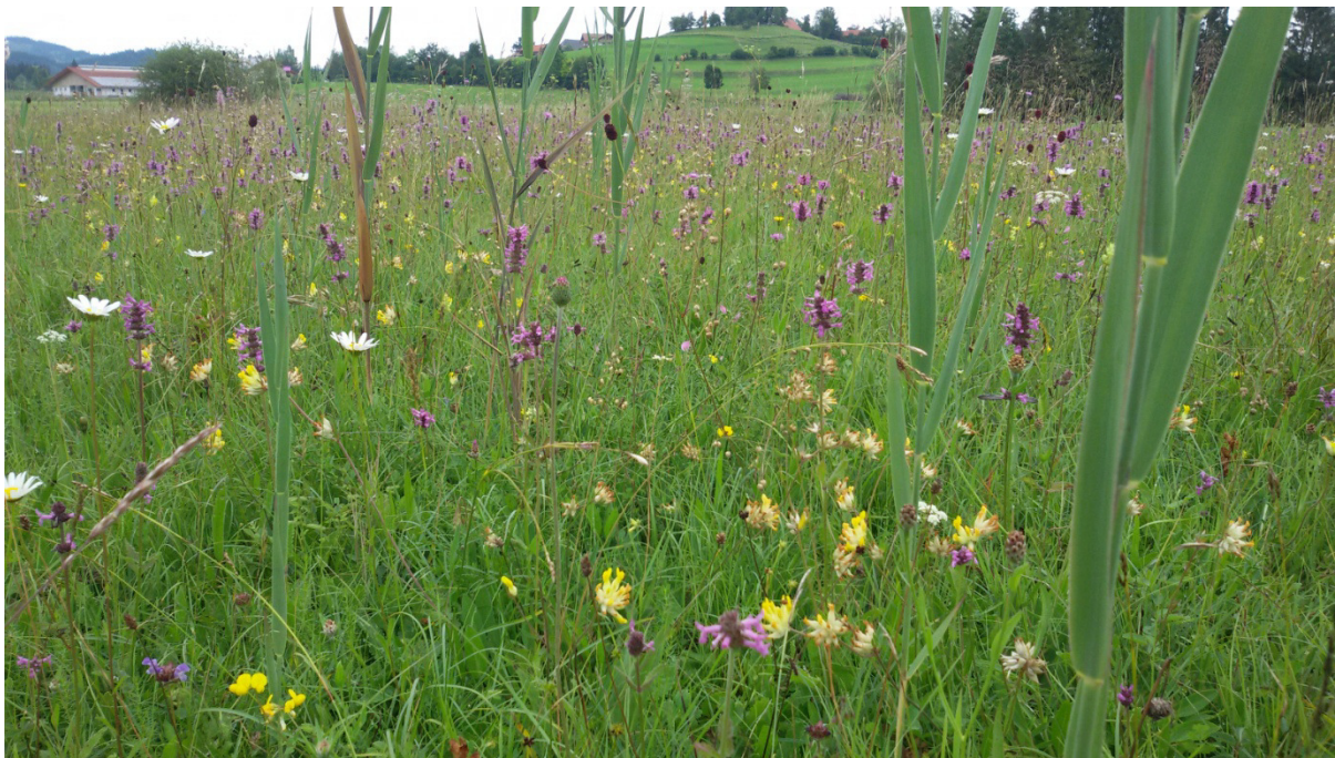
Abb. 15: Früh-Sommeraspekt einer Pfeifengraswiese mit Übergängen zum Kalk-Magerrasen

Während Kalk-Niedermoore mit intaktem Wasserhaushalt als primär baumfreie Flächen auch natürlich vorkommen können, sind Pfeifengraswiesen in ihrem Erhalt von der Mahd im Spätherbst/Winter abhängig. Ihre Standorte wurden zur besseren Bewirtschaftbarkeit leicht entwässert. Bei Aufgabe der Nutzung tritt daher eine Verbuschung bis zur Wiederbewaldung ein. Neben der namensgebenden Art Pfeifengras sind auch hier viele seltene und gefährdete Arten beheimatet, so die Pracht-Nelke, der Schwalbenwurz- und der Lungen-Enzian.