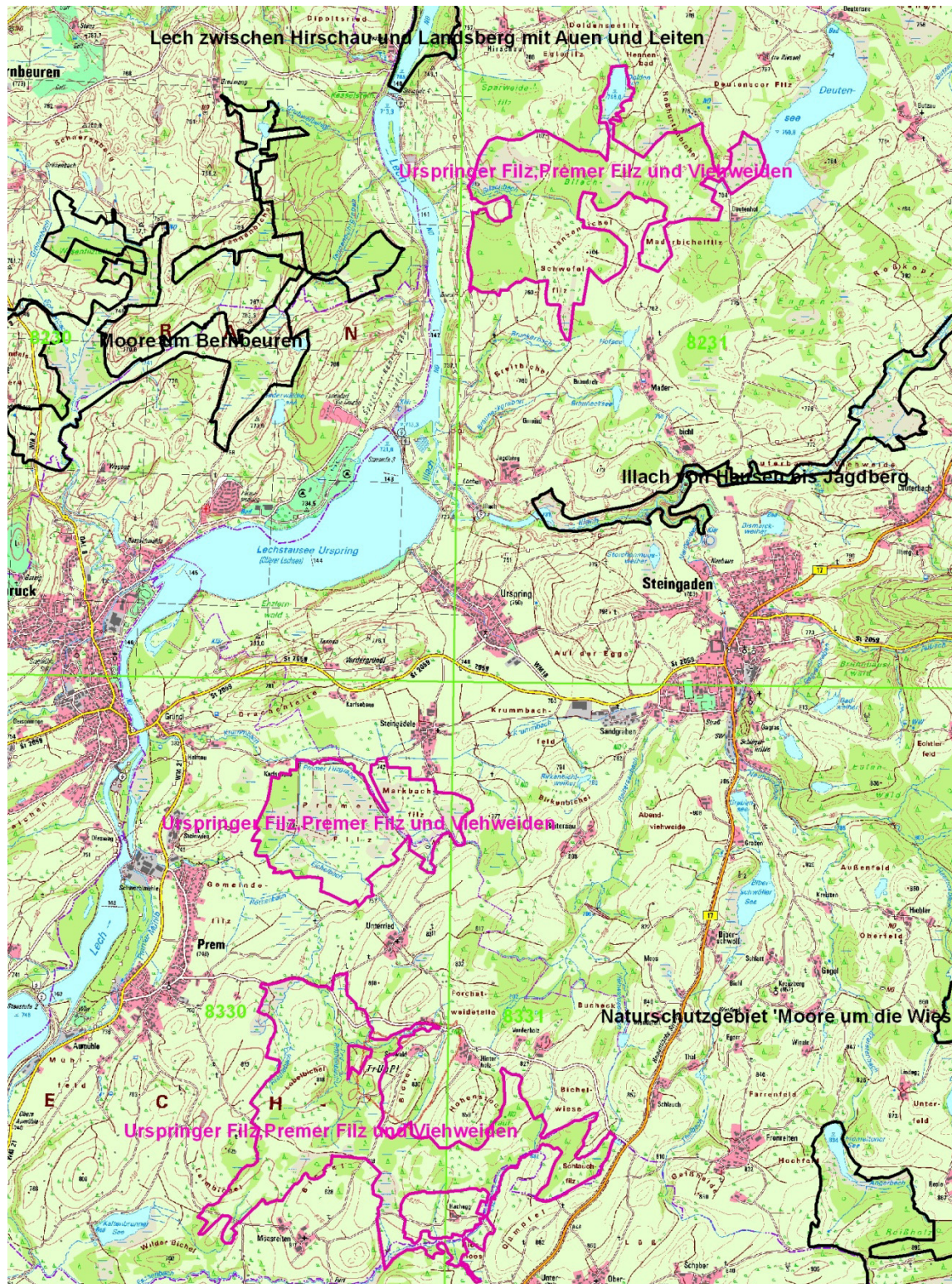
Abb. 1: Gesamtübersicht FFH-Gebiet 8330-371 „Urspringer Filz, Premer Filz und Viehweiden“ (pink: das zu bearbeitende FFH-Gebiet, schwarz: weitere, nahe gelegene FFH-Gebiete mit vergleichbarer Lebensraumtypenausstattung)