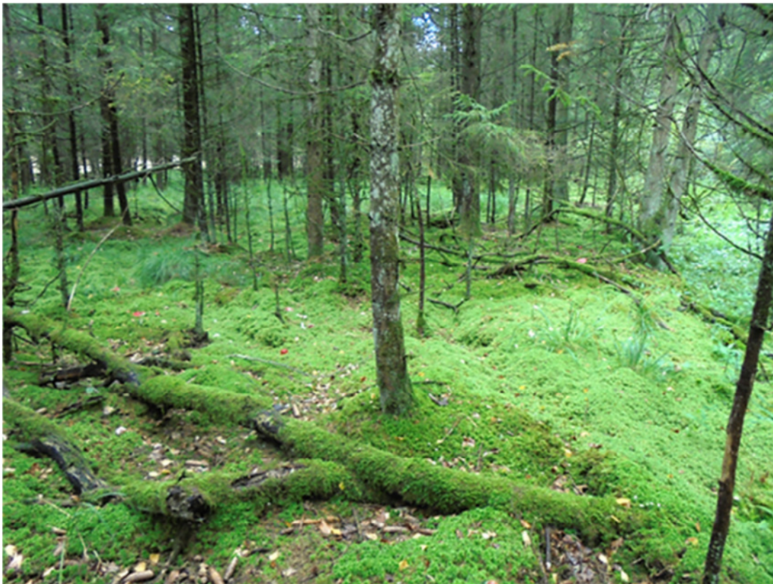
Abb. 18: Ein typischer Fichtenmoorwald (91D4*) im Landkreis Weilheim.

Moorwälder sind naturnahe, von den Baumarten Fichte, Kiefer, Birke dominierte, mehr oder weniger geschlossene Wälder auf stark sauren Torfböden der Hoch-, Übergangs- und Niedermoortorfe. Standortlich prägend ist ein Faktorenkomplex aus Wasserüberschuss in Kombination mit sauren, zumeist sauerstoff- und nährstoffarmen Standortbedingungen. Besonderheit: Wald auf Sonderstandort; Ges. geschütztes Biotop nach § 30 BNatSchG