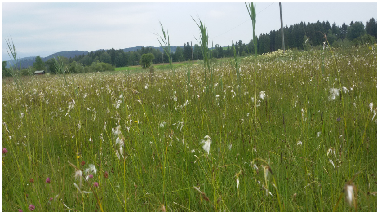
Abb. 8: Kalk-Flachmoor, Aspekt von Breitblättrigem Wollgras

Kalkreiche Niedermoore entwickeln sich bei hochanstehenden kalkreichen Grundwasser. Sie werden von Sauergräsern wie dem Breitblättrigen Wollgras sowie Seggen geprägt. In dieser niedrigwüchsigen Grasmatrix finden viele konkurrenzschwache Arten wie Orchideen, Mehl-