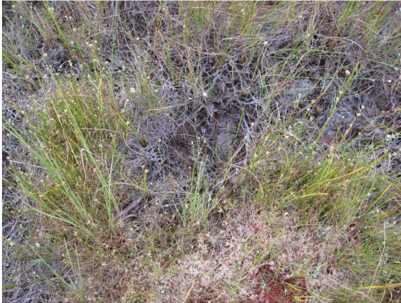
Abb.14: Moorschlenke mit Torfmoosen und Weißem Schnabelried