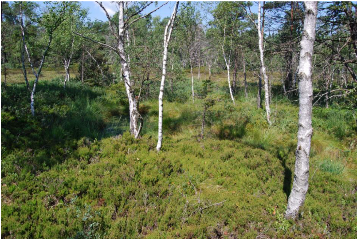
Abb. 13: Hochmoor mit Aufwuchs von Birken und nahezu flächendeckenden Vorkommen von Heidekraut

Häufig wurden in der Vergangenheit Hochmoore entwässert, um sie besser nutzen zu können, sei es als Torfstich oder als Streuwiese. Heute ist diese Nutzung nicht mehr üblich, häufig wurden deshalb die Hochmoore aufgeforstet oder haben sich selbst bewaldet. Als „renaturierungsfähig“ wird eine Wiederherstellung eines Moores z. B. durch Wiedervernässung im Zeitraum von weniger als 30 Jahren angesehen.