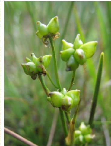
Abb. 12: Blumenbinse

binse besiedeln zusammen mit Torfmoosen die Fläche. Häufig sind Abfolgen von Nieder- moor, Zwischen- und Hochmoor ausgebildet.