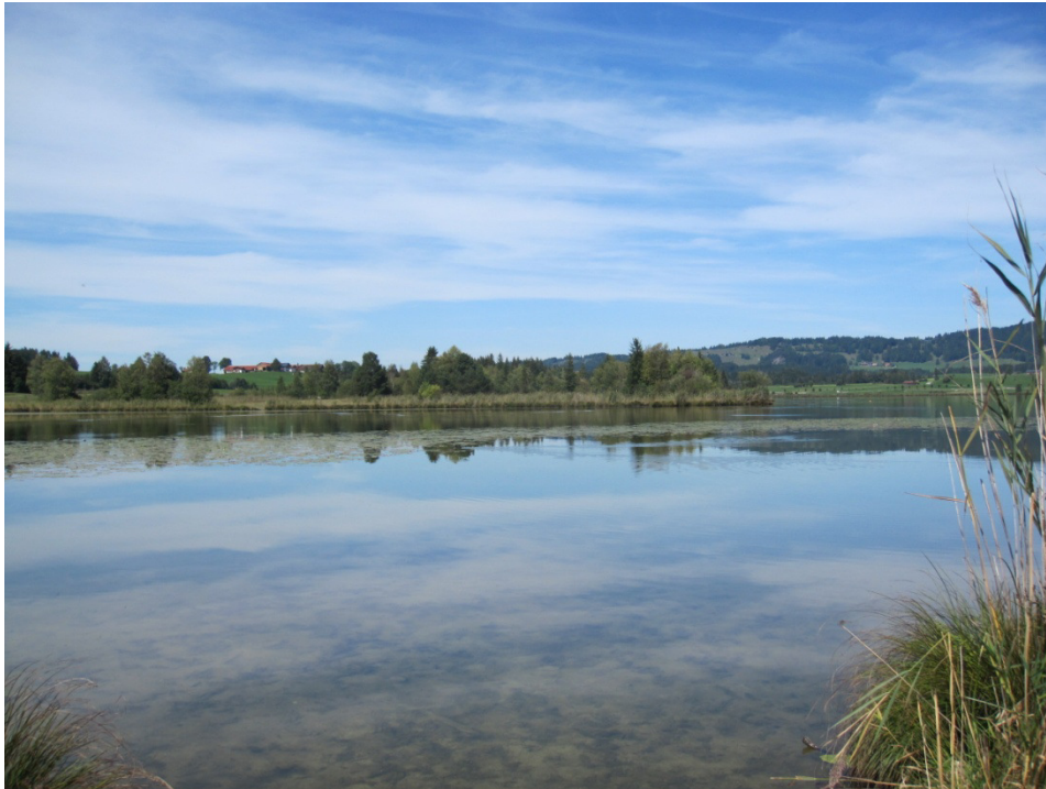
Abb. 2: See mit Schwimmblattvegetation aus Gelber Teichrose und Röhrichtzone am Ufer

Stillgewässer mit Flachwasserzonen, in denen Röhrichte und Schwimmblattvegetation gedeihen, bieten Fischen, Libellen, Amphibien und Wasserinsekten Lebensraum, Nahrung und Versteckmöglichkeiten.