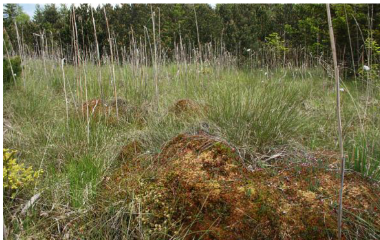
Abb. 11: Übergangsmoor mit Weißer Schnabelbinse und Bleichmoos-polstern

Während die kalkreichen Niedermoo- re von hochanstehenden, kalkreichen Grundwasser geprägt sind, nimmt der Einfluss des Grundwassers bei den Übergangsmooren ab und Pflanzenarten wie die Weiße Schnabelbinse, der Fieberklee, Schnabel-Segge und Blumen-