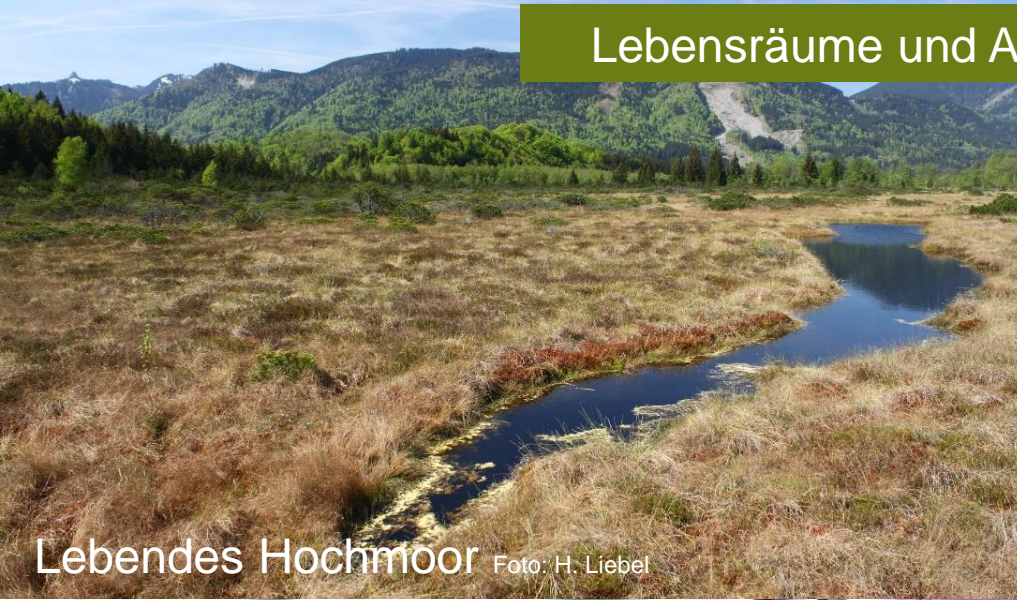
Lebendes Hochmoor