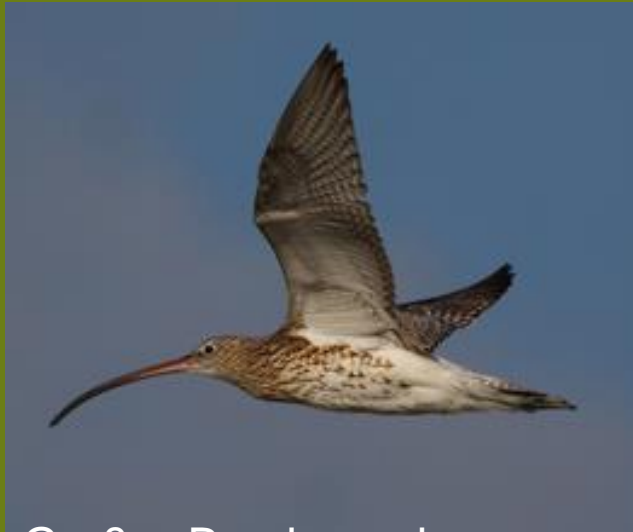
Großer Brachvogel