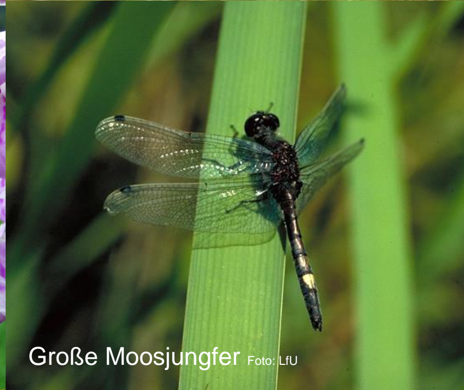
Große Moosjungfer