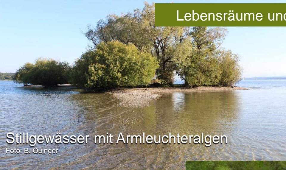
Stillgewässer mit Armleuchteralgen