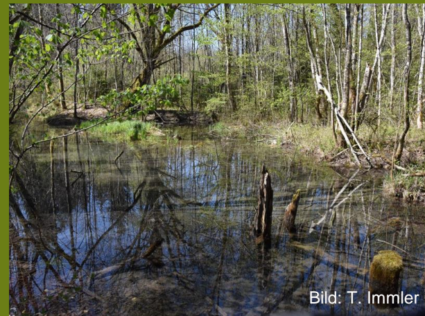
Weichholzauwälder mit Erle, Esche und Weide