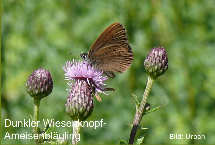
Dunkler Wiesenknopf- Ameisenbläuling